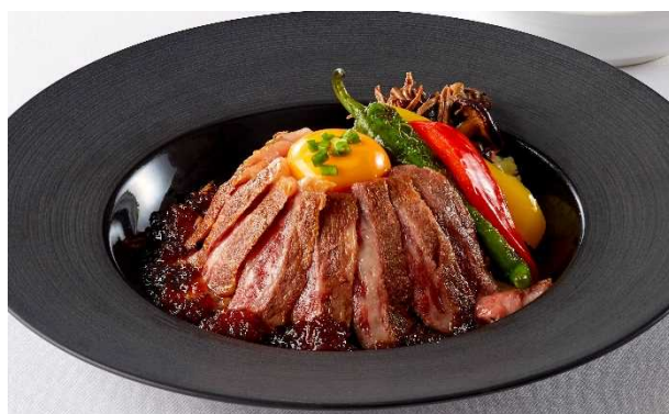
かずさ和牛と米新品種「粒すけ」のステーキボール