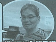
パソコン入門受講

パソコンにほとんど触ったことがなかったので不安でしたが、無料説明会に参加して、先生たちの明るさに惹かれて入学を決めました。パソコンは本当に便利で、使えると毎日が楽しいです。来てよかったです。